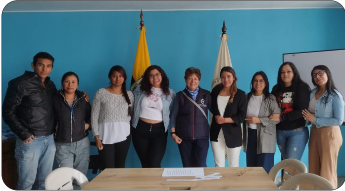
Le personnel du Centre Mushuk Pakari

L'Équateur traverse une crise interne d'une ampleur sans précédent, considérée en 2023 comme l'un des pays les plus dangereux du continent, plate-forme du narcotrafic en Amérique du Sud. Le personnel, les bénéficiaires et leurs familles, habitués à gérer de multiples crises, font preuve d'une grande résilience face à la montée de la violence et de l'insécurité, de l'inflation et à l'augmentation des prix. Le Centre Mushuk Pakari n'a pas cessé ses activités ni fermé ses portes durant le projet.