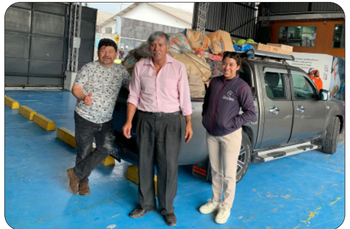
Ravitaillement à la Bourse alimentaire

Grâce à une excellente collaboration de longue date avec le « Rotary Club Quito Colonial » et avec la Fondation de la Compagnie d'assurances « Zurich Equateur », la Fondation Wiñarina a réussi à initier deux formations professionnelles en boulangerie-pâtisserie ainsi que deux formations professionnelles pour la conception de produits d'hygiène et de nettoyage. Les participant(e)s sont en général des membres de famille des enfants qui fréquentent le Centre Mushuk Pakari. Grâce à l'Atelier « Màs que pan » (Plus que du pain), ils peuvent s'assurer un petit revenu par la vente de petits pains et d'« empanadas » et améliorer ainsi leur estime de soi.