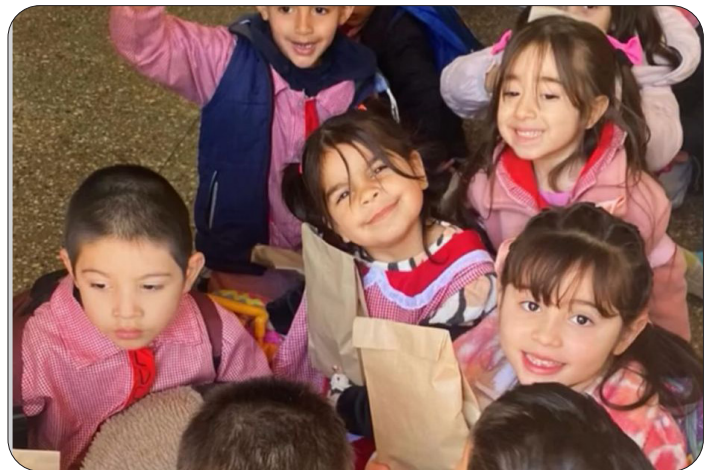
Jardin d'enfants Cariñito

En tant qu'équipe, nous continuons à nous former pour offrir des services de qualité. Nous avons approfondi nos connaissances sur des thèmes tels que la protection de l'environnement, la gestion des conflits, le leadership, l'entrepreneuriat, la communication assertive, la loi Micaela et la gestion des déchets. Nous avons également eu l'honneur de recevoir la distinction « Valeurs Démocratiques, décernée par la Chambre des Députés de la province de Santa Fe.